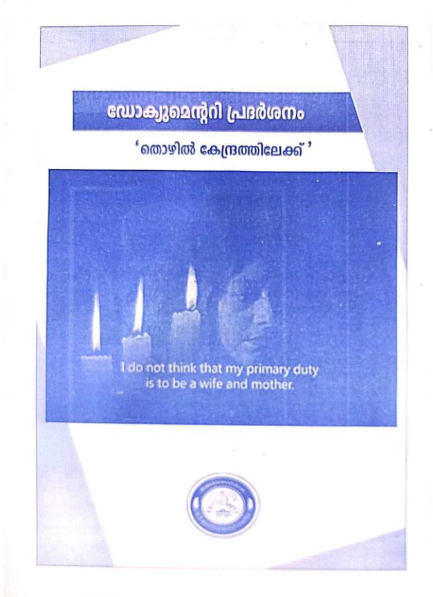
Documentary exhibition posters in the year 2019