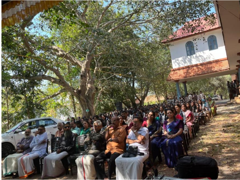
V. T. Commemoration in the year 2024