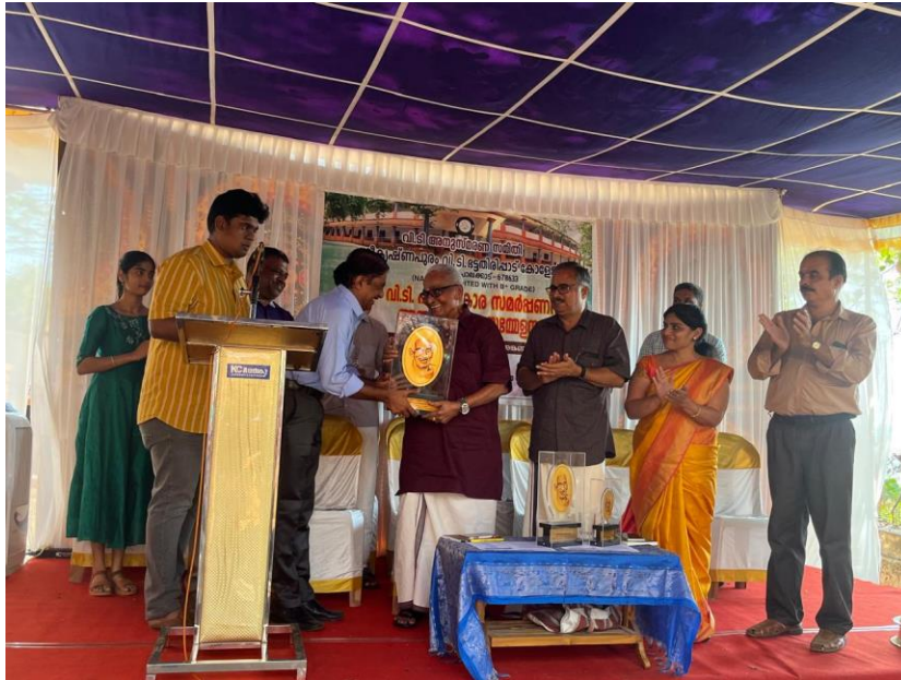
V. T. Award to Kalamandalam Gopi in the year 2024