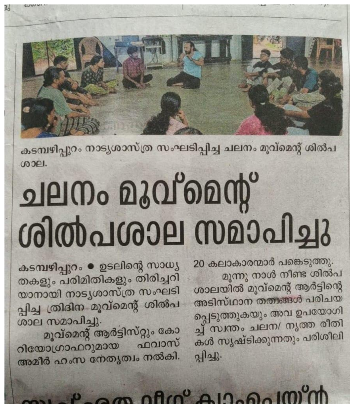
News paper cutting on workshop on movement in theater acting on 27/03/2023