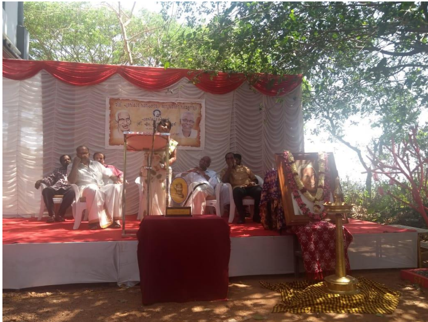
V. T. Commemoration function in the year 2019