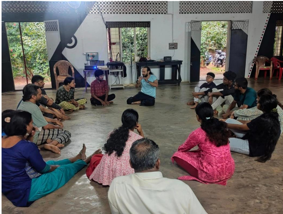
Workshop on Theater acting on 27/03/2024