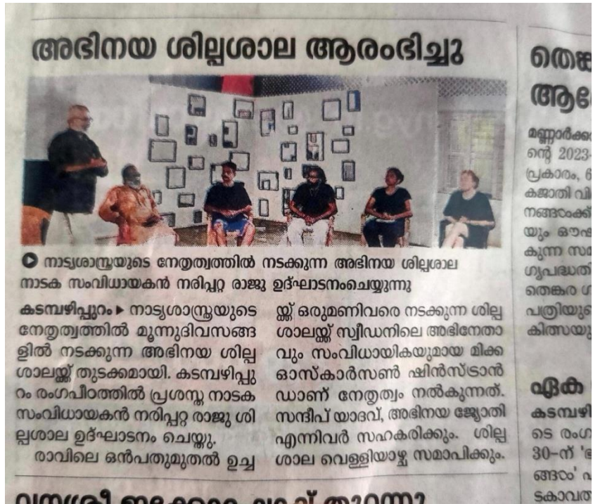
Workshop on theater acting on 27/03/2024