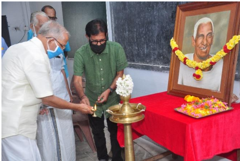
V. T. Commemoration inauguration in the year 2022