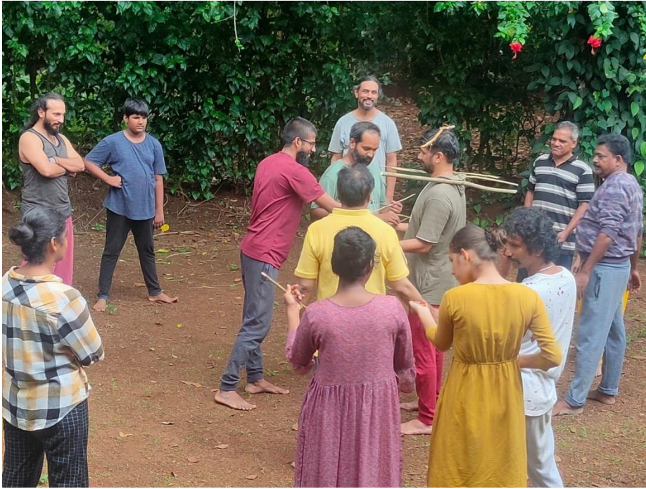
Workshop on Calanam on 27/03/2023